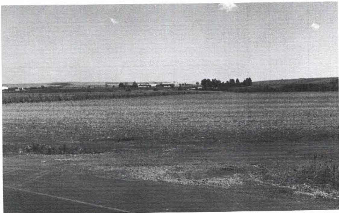
Figura 3 Registro do Acesso Irregular